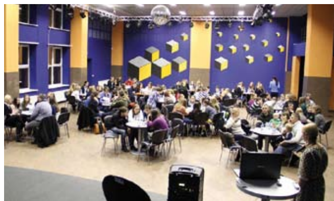
Erdviose JUC patalpose vyksta įvairūs renginiai jaunimui, diskotekos, filmų peržiūros

JUC pradėjo vykdyti naują projektą „Paslaugų plėtos ir gerovės jaunimui didinimas“, kurio tikslas – didinti rizikos grupės vaikų ir jaunimo gerovę ir mažinti socialinę atskirtį Druskininkų savivaldybėje. Praplečiant jaunimo