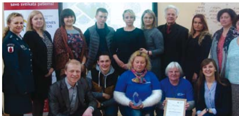
Už aktyvią sveikatos stiprinimo veiklą nugalėtojos vardas atiteko kaimo bendruomenei „Pažagieniai“

Geriausiai įvertinta kaimo bendruomenė „Pažagieniai“. Jai suteiktas sveikatą stiprinančios bendruomenės vardas ir skirta Visuomenės